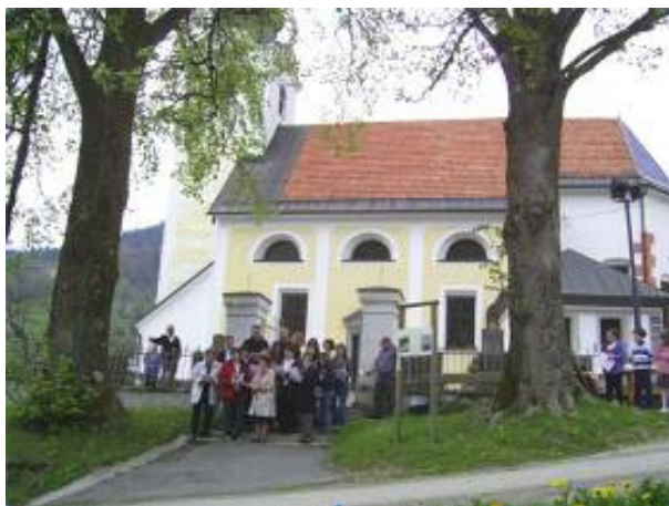
Mešani pevski zbor iz Motnika.