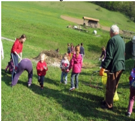
Motniški polžki aktivni v čistilni akciji

V soboto, 16.4.2011 je tako kot v mnogih krajih po Sloveniji tudi v Motniku potekala čistilna akcija.