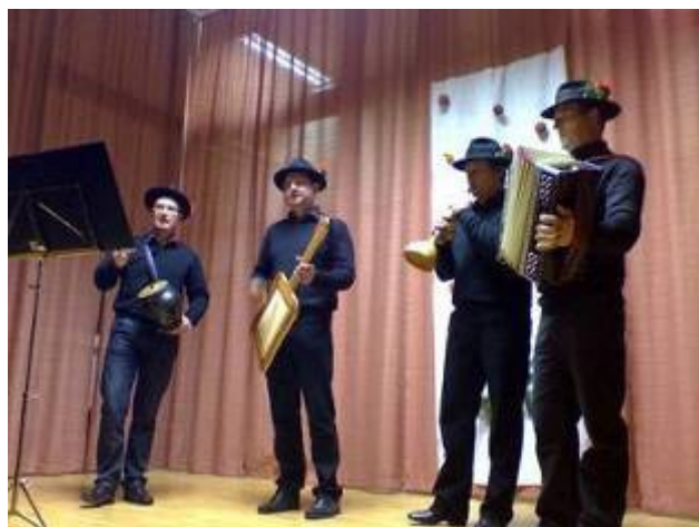
Pevska skupina »Pustrovžeki« na motniškem odru,

mož vsakega otroka poklical po imenu in mu izročil lepo darilo. Veselja kar ni hotelo biti konec, vse dokler se dragi Miklavž ni poslovil in obljubil, da se vrne spet v prihodnjem decembru.