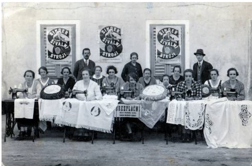
Tečaj učenja ročnih del in rišeljeja na šivalnih strojih Singer. Slikano okrog leta 1920, original slike hrani prof. Jožica Snoj Senegačnik iz Ljubljane

Tekst: M. Drolc, slike: arhiv društva Utrip, M. Drolc