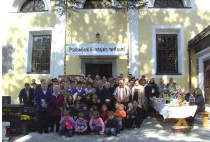
Skupinska slika župljanov s slavljencem