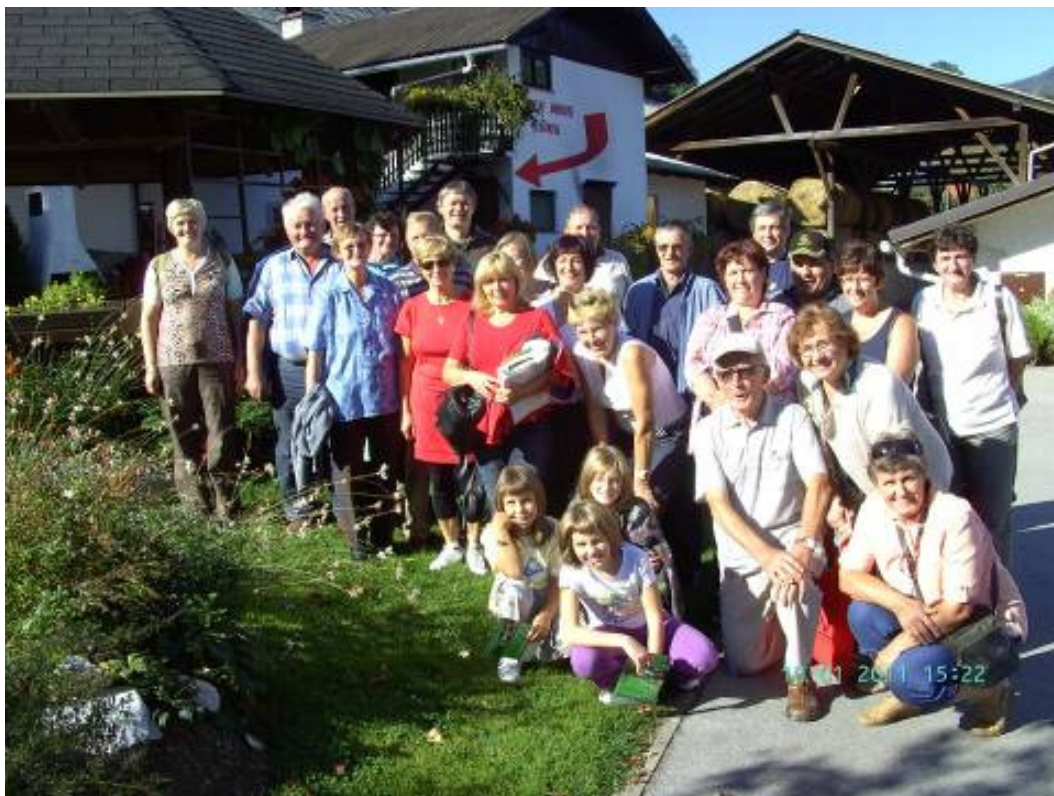
Izletniki pred kmetijo Klančnik

V prelepem sobotnem jutru se je prek trideset članov in simpatizerjev Podeželskega društva - Utrip pod lipo domačo iz Motnika odpravilo na enodnevni izlet na Koroško. Vodil nas je prijazni vodič Miha in nam že med potjo povedal marsikaj zanimivega. Najprej smo se ustavili v Libeličah, v