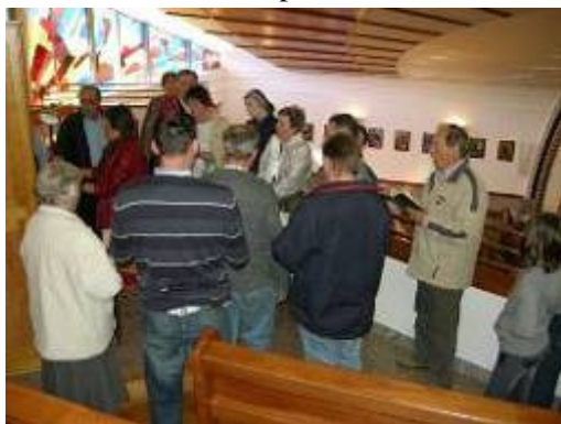
Ob spremljavi orgel so motniški pevci rade volje zapeli. Tekst in slike: Marina Drolc, arhiv kamničan.si

»Sodeč po veselem in dobrem odzivu vseh udeležencev izleta, lahko rečem, da smo preživeli kratko, a kulturno bogato, prijetno, živahno in veselo nedeljsko popoldne, ki nam ga je v polni meri polepšalo tudi čudovito sonce. V prepričanju, da je to bilo res prijetno druženje, ki ga bo vredno ponoviti večkrat, smo se domov vrnili pravočasno in tako, kot smo obljubili«, je članek zaključila Marina Drolc.