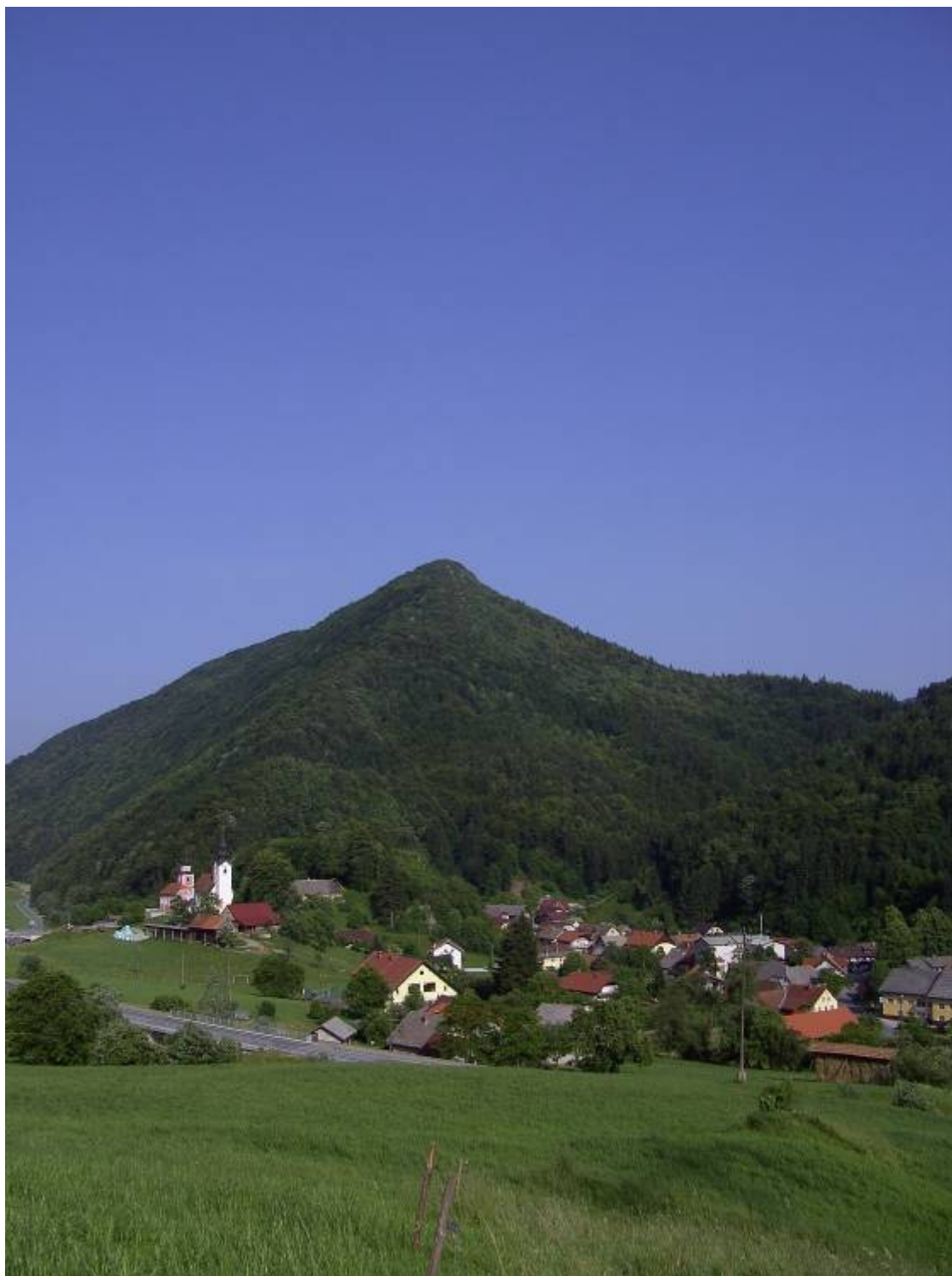
Motnik s severozahodne smeri, slikano z Bele nad Motnikom (avgust 2010)