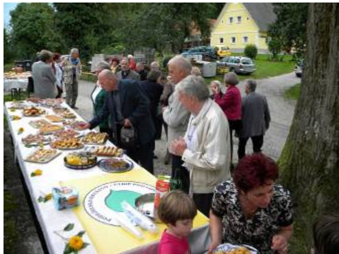
Pogostitev pod vaškimi lipami.