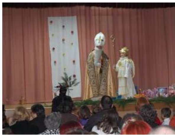
Motniške otroke je obiskal sv. Miklavž.

Najprej so motniški pa tudi špitališki otroci na odru motniškega kulturnega doma lepo zaplesali in v prijetni zgodbici ob dobrih vilah predstavili prijeten program, prepleten z zgodbami o Janku in Metki, o Rdeči kapici in še o čem. Končno so vsi zbrani otroci le priklicali dobrega moža Miklavža, ta pa jih je ob spremstvu angelov in porednih parkljev lepo pozdravil, jih pohvalil za pridnost, izkazano v zadnjem letu do svojih staršev, v šoli in povsod tam, kjer so se kakorkoli izkazali. Končno je dobri