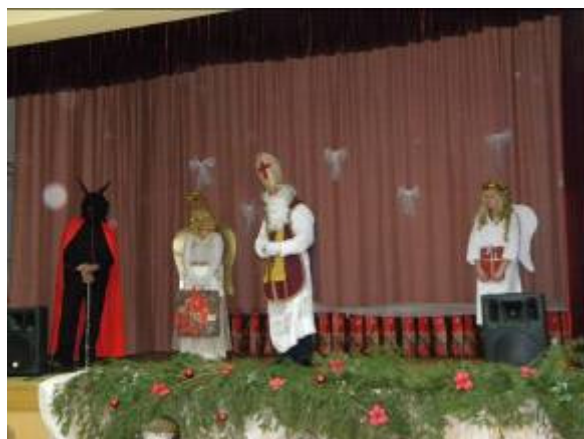
Miklavž s spremstvom

Motnik (6.12.2010) - Tudi letos je Motnik obiskal dobrotnik Sv. Miklavž. Čeprav se mu je mudilo naprej, je vseeno pokukal v dvorano Kulturnega doma, kjer so se zbrali pridni otroci. Vesel je bil, da starši tako pridno učijo svoje otroke lepega vedenja in dobrote. Vesel je bil tudi tistih, ki so ga povabili; pod okriljem Podeželskega društva – Utrip pod lipo domačo, Motnik, pa Krajevna skupnost, ki je primaknila cekine in seveda nastopajočih, ki so pomagali izpeljati program. Obljubil je kljub temu da je potožil o starosti, da bo drugo leto spet prišel. Nekateri so opazili, da je prišel iz smeri Štajerske, zato ni čudno, da se mu je mudilo naprej, ker je imel pred seboj še toliko dolge poti in toliko pridnih otrok. Hvala ti, Miklavž, za polne vreče dobrot.