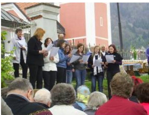
Mladinski dekliški pevski zbor