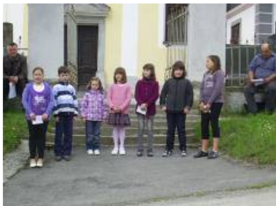
Motniški otroški pevski zbor