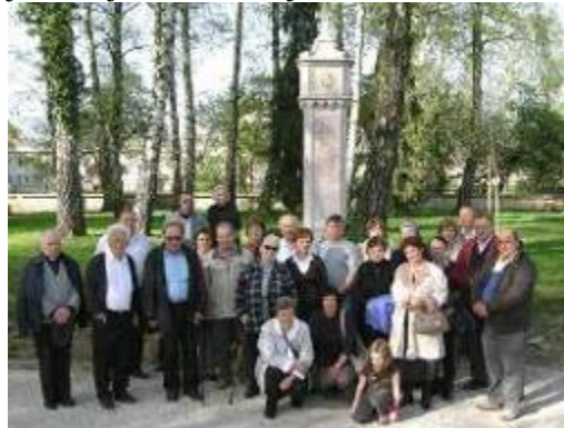
Skupinska fotografija udeležencev izleta v Prešernovem gaju