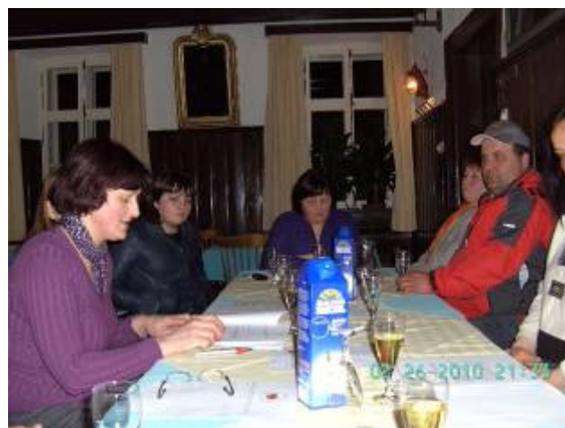
Udeleženci ustanovnega sestanka pri »Flegarju« v Motniku, 26.2.2010