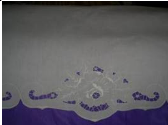
In novi izdelek v letu 2011