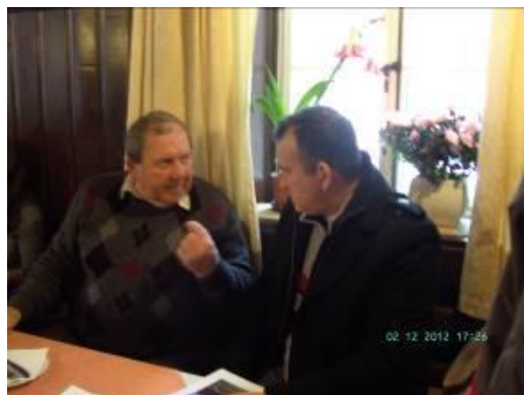
Udeleženci občnega zbora »pri Flegarju« v Motniku