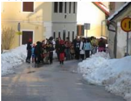
Udeleženci pustnega rajanja v Motniku Tekst in slike: motnik.net