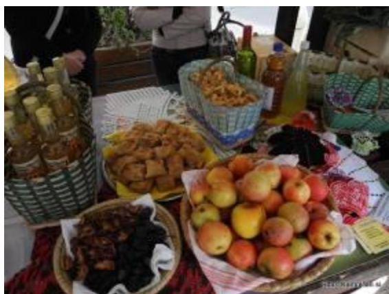
Veliko je bilo medu in drugih čebelarških produktov Tudi ostalih dobrot ni manjkalo