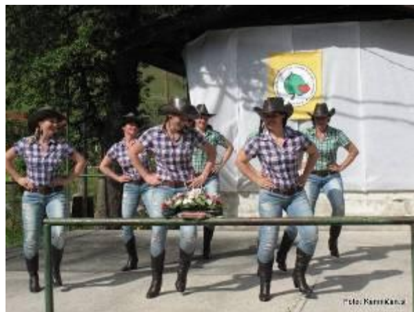
Kulturno plesna skupina iz Sv. Jurija ob Ščavnici, ki je navdušila s Kan-Kanom, nato pa zaplesala še v kavbojskih ritmih