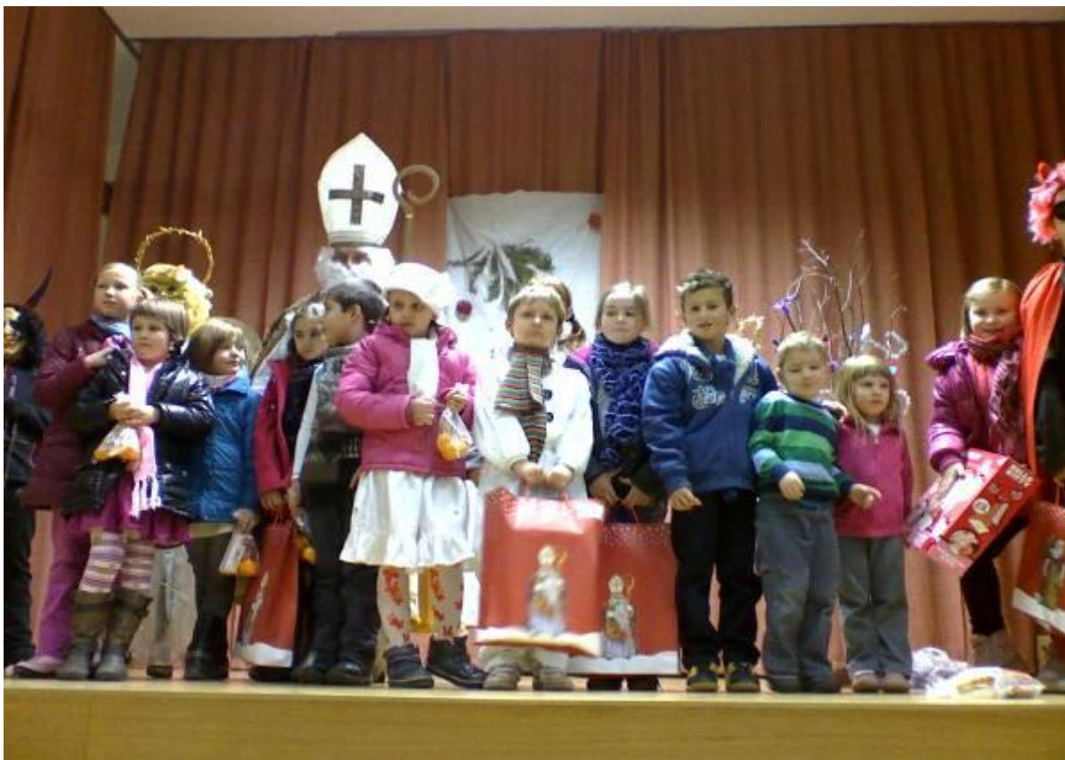
Skupinska slika Miklavža z otroki Motnik, 1. decembra 2012 ob 15.30, tekst in slike: M. Drolc