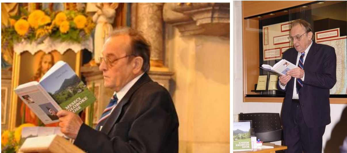
Predstavitve knjige Meseci globoke rose v Motniku, september 2010 Predstavitve v Kranju, oktober 2010