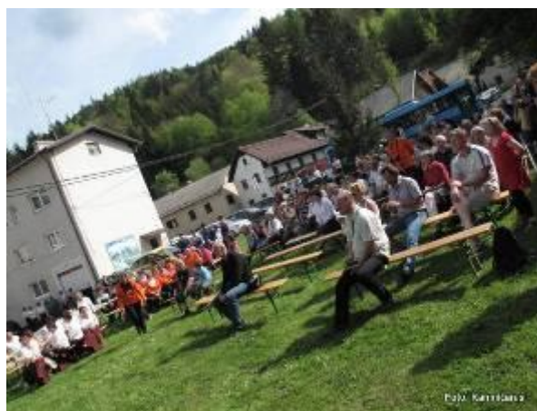
Številni obiskovalci prireditve