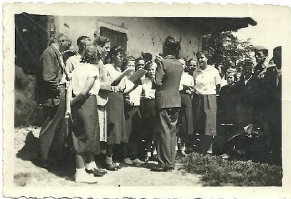
Motniški pevci po maši v cerkvi sv. Nikolaja v Beli, pred Mežnarjevo domačijo v Beli.