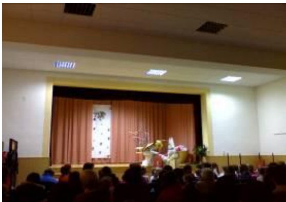
Miklavž med otroki