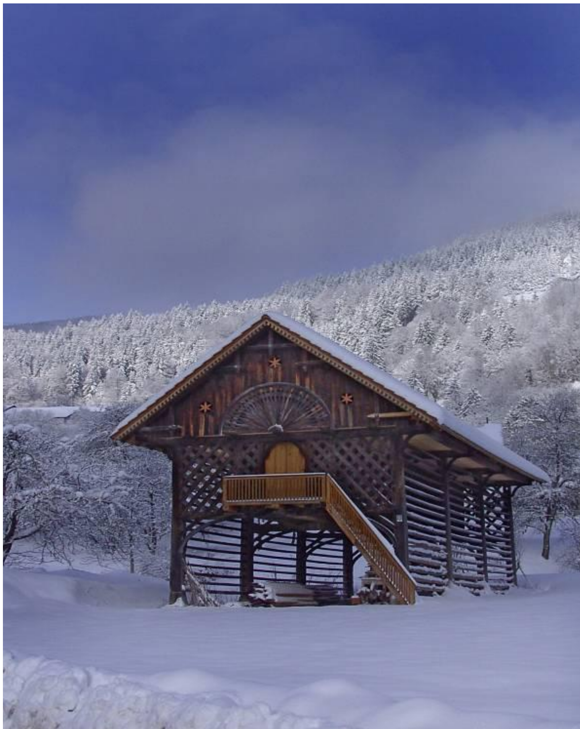
Motniški lepoteč – Vrbanoučev kozolec