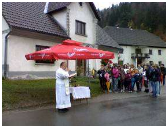
Blagoslov obnovljene kapelice sv. Marije na vzhodnem delu Motnika. Tekst in slike: Marina Drolc.