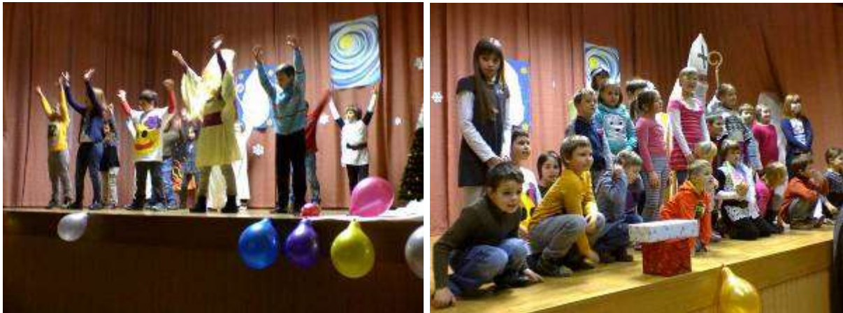
Motniški polžki in Miklavž z njimi v motniškem kulturnem domu.

V nedeljo, dne 1. decembra, je v dvorani kulturnega doma v Motniku obiskal dobri Miklavž motniške otroke. Glede na to, da je moral obiskati še veliko otrok, je s svojimi parkeljmi prišel v Motnik zelo zgodaj in obdaril čez petdeset tistih, ki so bili v tem letu zelo pridni. Pred prihodom dobrega moža so motniški Polžki nastopili v prijetnem programu z recitacijami in plesom, po glasnem vzklikanju pa so dobrega moža vendarle priklicali v dvorano in ga toplo pozdravili. Vsi otroci so se za lepa darila dobremu možu lepo zahvalili ter se v veselem razpoloženju od njega poslovili z obljubo, da bodo starše ubogali tudi v naslednjem letu in se skupaj z njimi veselili Miklavževega ponovnega obiska v Motniku. Ob zahvali dobremu možu Miklavžu za obisk motniških otrok, se društvo Utrip kot organizator druženja zahvaljuje tudi Krajevni skupnosti Motnik, ki je prispevala polovico potrebnih sredstev.