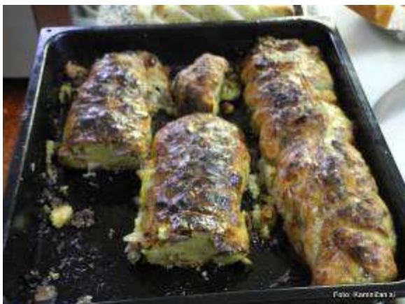
Tuhinjska velikonočna fila, ki so jo pri Flegarju pripravili posebej za to priložnost.