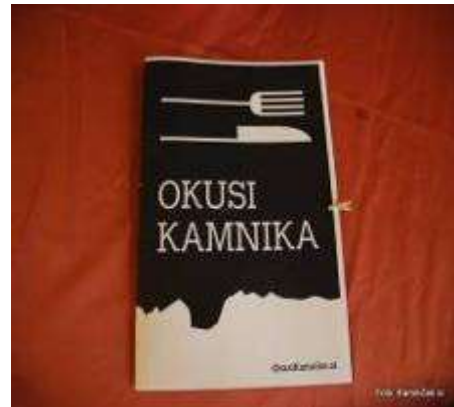
Slike s predstavitve tipičnih jedi v Kamniku (zgoraj in levo spodaj).