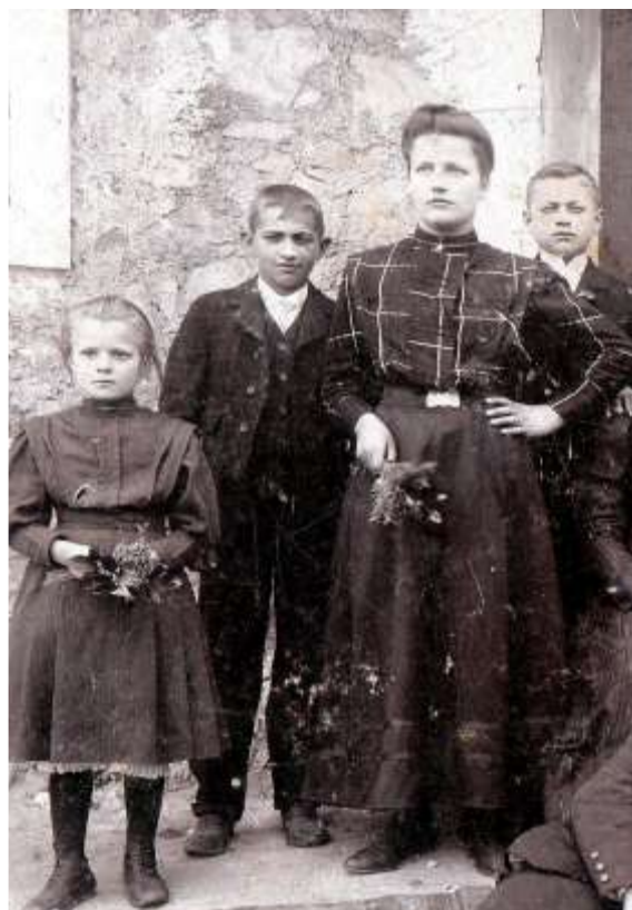
Slika 4: Križnikovi otroci.

Čeprav je Motnik majhen kraj, so imeli v letih pred prvo svetovno vojno in po njej dobro razvito kulturno življenje. Tega je vodil in podpiral župnik Plahutnik. Vedno je govoril, da je treba mladini dati tudi kulturo.