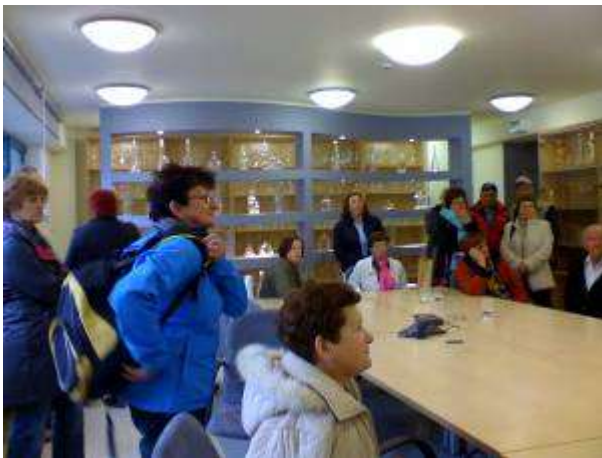
Ogled steklarne Hrastnik. Tekst in slike : Marina Drolc.

Člani podeželskega društva Utrip - pod lipo domačo, Motnik smo se 12.10.2013 udeležili lepega izleta z ogledom Hrastnika, Sevnice in Lisce. Posebej zanimiv je bil voden ogled v steklarni Hrastnik, kjer nam je vodič predstavil zgodovino steklarne in nas popeljal tudi v del proizvodnje steklenic. Pot smo nadaljevali do Sevnice, si pod vodstvom lokalne vodičke ogledali lepo obnovljen sevniški grad ter v kleti gradu pokušali izvrstno vino in domačo salamo, narezano z ročno izdelano leseno salamoreznico. Zapeljali smo se tudi do vinske kleti Mastnak na posestvu Krakovo, občudovali vinograd, čudovito klet in ob degustaciji šampanjca, njihovih vin in domačega narezka izvedeli veliko zanimivega. Po programu smo se nato podali na visoko Lisco in v Tončkovem domu uživali ob dobrem kosilu. Vtisi s celotnega izleta in zanimivega izletniškega dneva so bili lepi in prijetni.