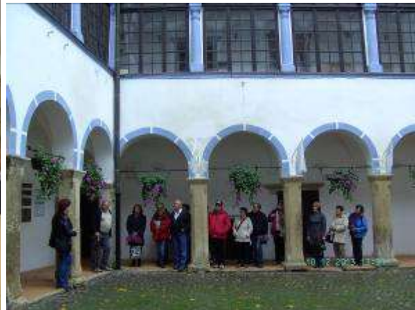
Izletniki na dvorišču sevniškega gradu.