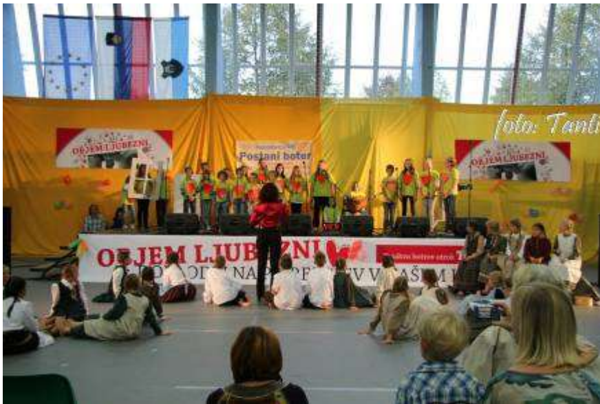
Tekst: M. Drolc, slika: arhiv društva Utrip.

Podeželsko društvo Utrip iz Motnika je sodelovalo na septembrski dobrodelni prireditvi, organizirani za izgradnjo sirotišnice Loveable home in pomoč socialno ogroženim. Člani društva botrov otrok TWIMC so poslali lepo zahvalo po prireditvi društvu Utrip, ki je tudi poskrbelo in pomagalo pri pogostitvi nastopajočih. Društvo botrov otrok je prostovoljno in nepridobitno društvo ter vse stroške krije iz lastnih dohodkov. Vsi nastopajoči so se odrekli honorarju, zato je bila pomoč v obliki različnih ročnih izdelkov in pomoč pri pogostitvi vseh udeležencev toliko bolj dobrodošla.