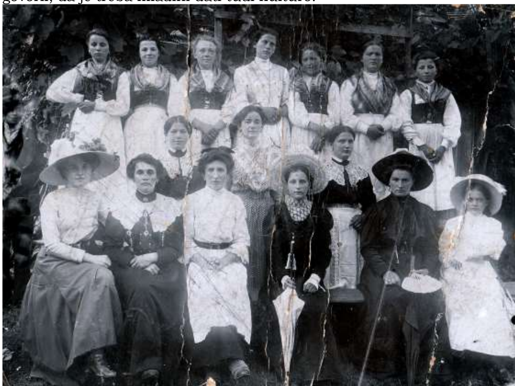
Slika 5: Igra iz leta 1912.

Čeprav je Motnik majhen kraj, so imeli v letih pred prvo svetovno vojno in po njej dobro razvito kulturno življenje. Tega je vodil in podpiral župnik Plahutnik. Vedno je govoril, da je treba mladini dati tudi kulturo.