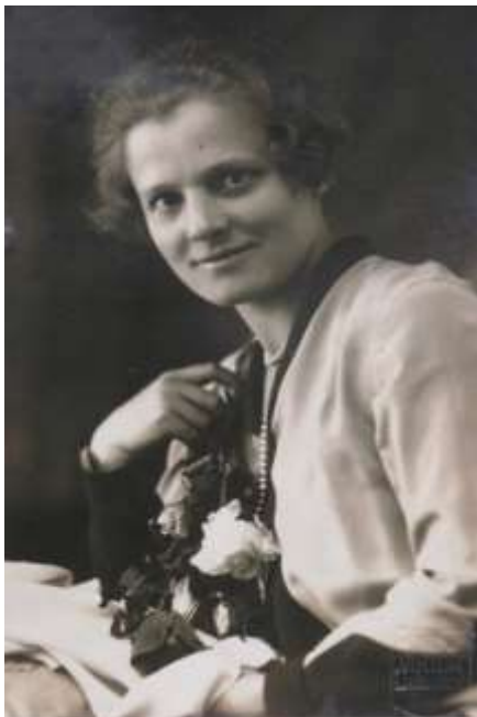
Slika 2: Križnikova najmlajša hči.

Gašperjeva hči Terezija (Rezka), poročena Erjavec, je kasneje živela v Ljubljani. Na motniškem ljudskem odru je velikokrat igrala zabavne vloge. Gotovo je njen igralski talent podedovala tudi njena hčerka Helena, poročena Medič, dramska igralka.