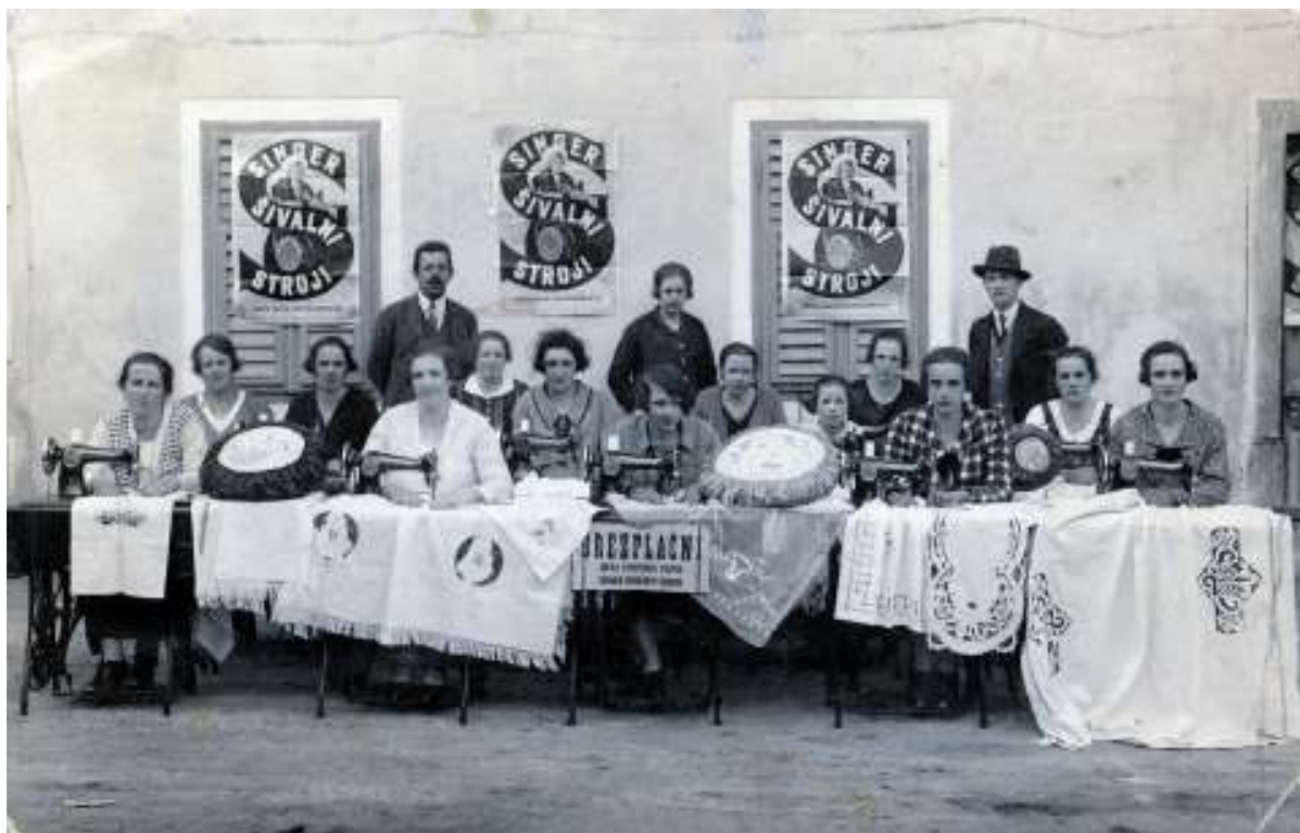
Slika 9: Udeleženke singerjevega tečaja.