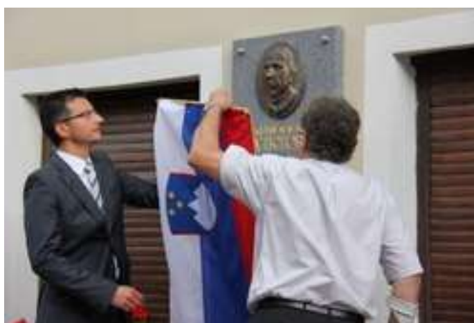
Tekst in slike: arhiv kamničan.si.