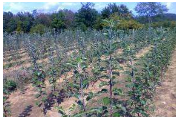
Samotarska čebela, ki izletava že v marcu (levo), vzgoja sadik (desno).