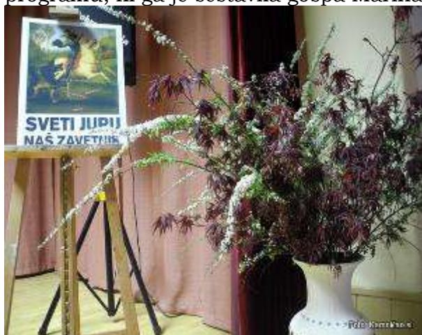
Dvorana kulturnega doma v Motniku.