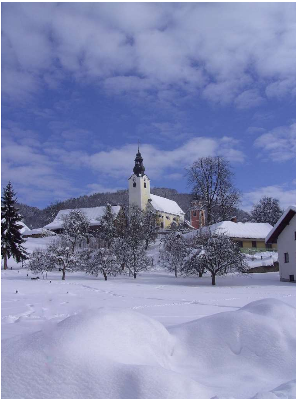
Zasneženi februar 2013 v Motniku.