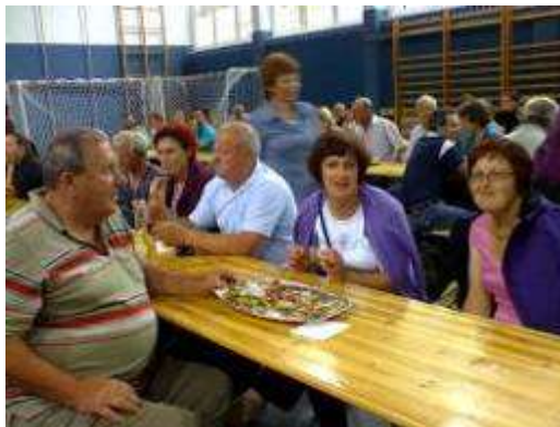
Pevci »Pustrovžeki« (slika levo), člani društva Utrip na koncertu (slika desno).