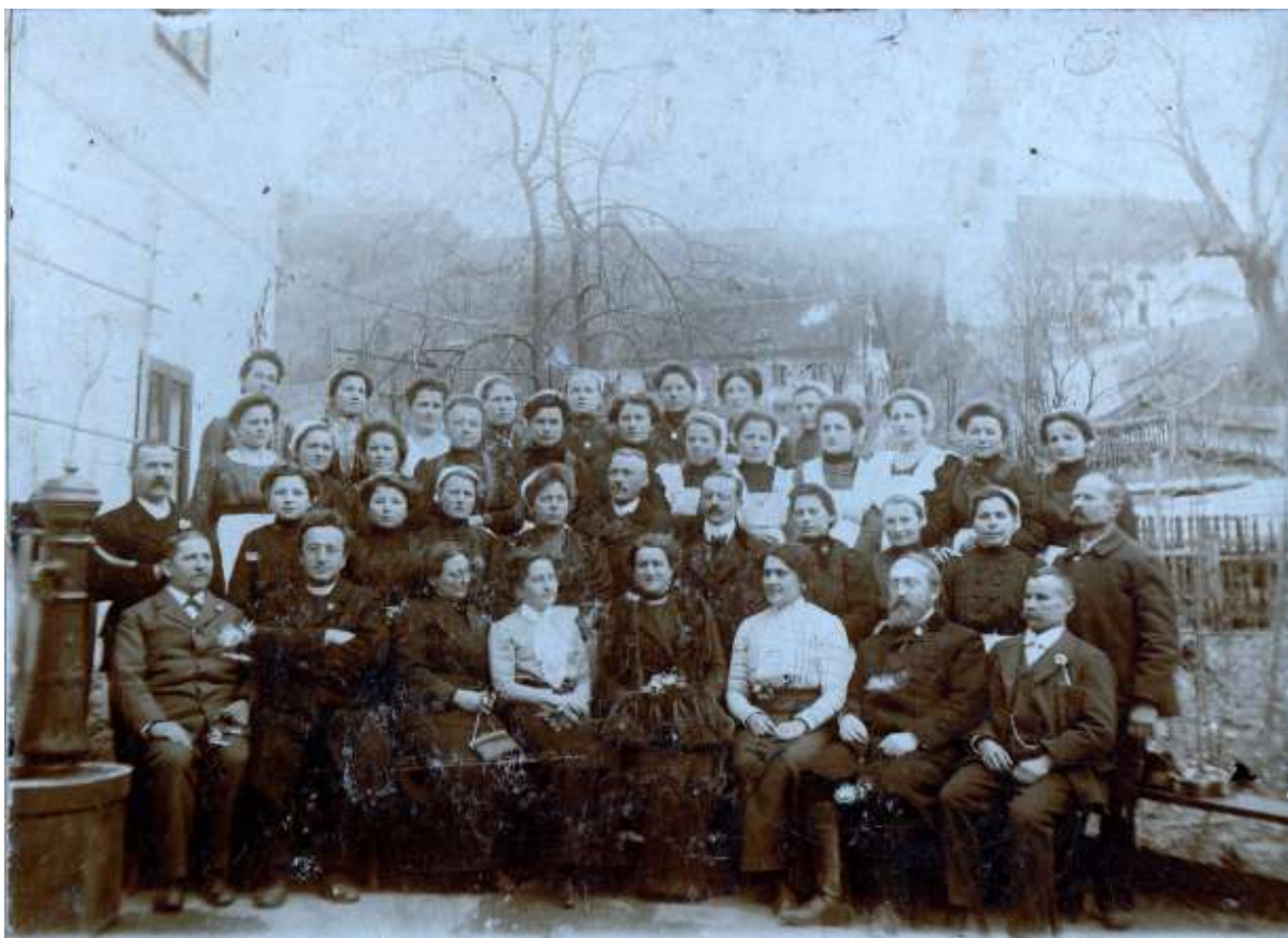
Slika 8: Gospodinjski tečaj, udeleženci so ob mežnariji, v ozadju Madjarjeva hiša in cerkev.

Naj napišem še nekaj mojih spominov na Motnik v času mojih počitnic pred drugo svetovno vojno.