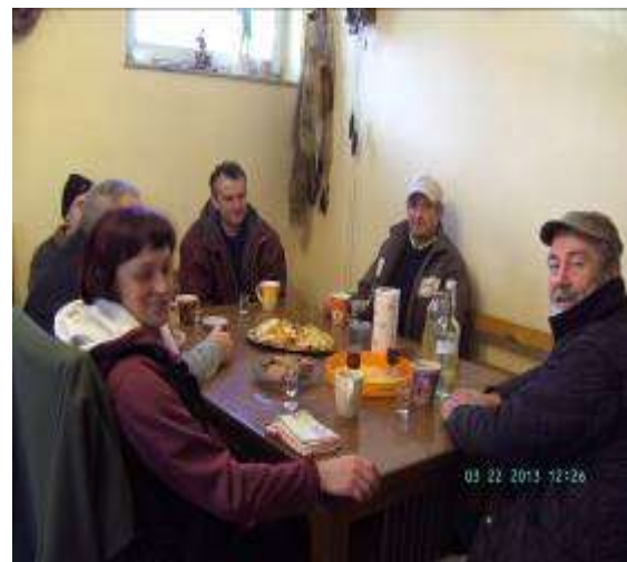
Prilegla se je dobra potica in topel čaj.