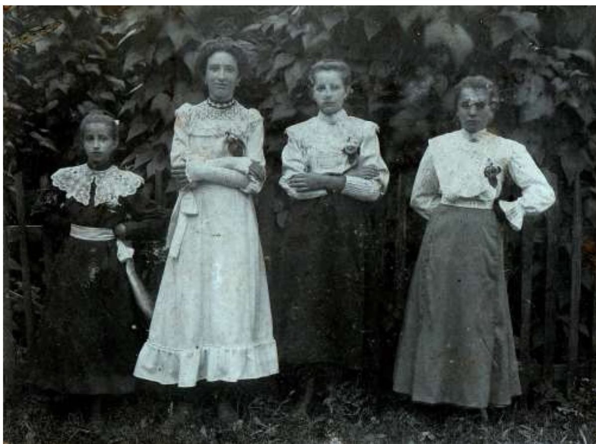
Slika 10: Motniška dekleta s šopki cvetja.