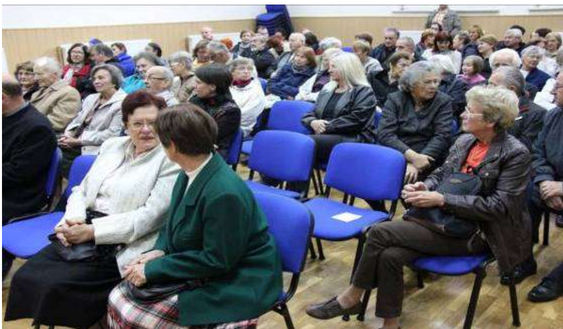
Obiskovalci prireditve v motniškem kulturnem domu, 6. 10. 2013.