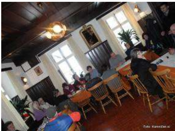
Udeleženci občnega zbora.