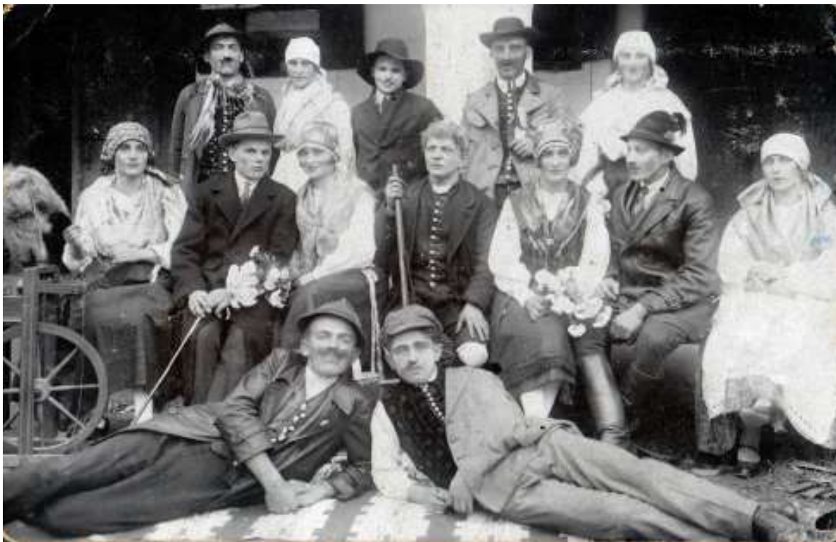
Slika 7: Igra »Divji lovec«.