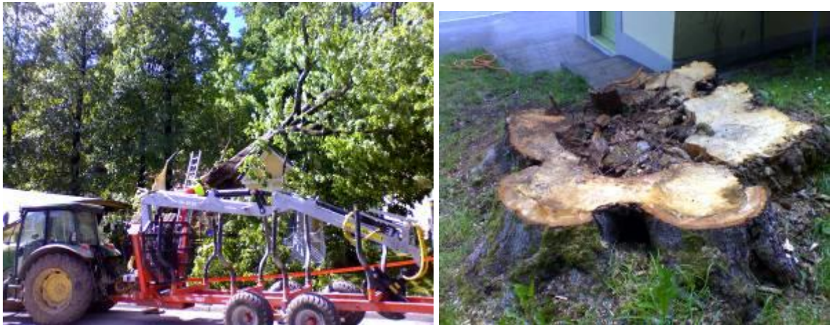
Tekst: Marina Drolc - Marjan Semprimožnik, slike: Marina Drolc.