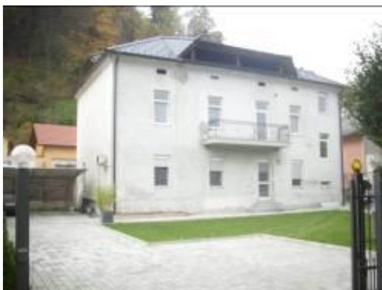
Vila Cecilija na Bregu v Celju, ki jo je zgradil Karl Bervar, v njej je bila njegova orglarska šola, slika: Milan Brišnik, 2014.

Podatke o Karlu Bervarju zbrala po virih: