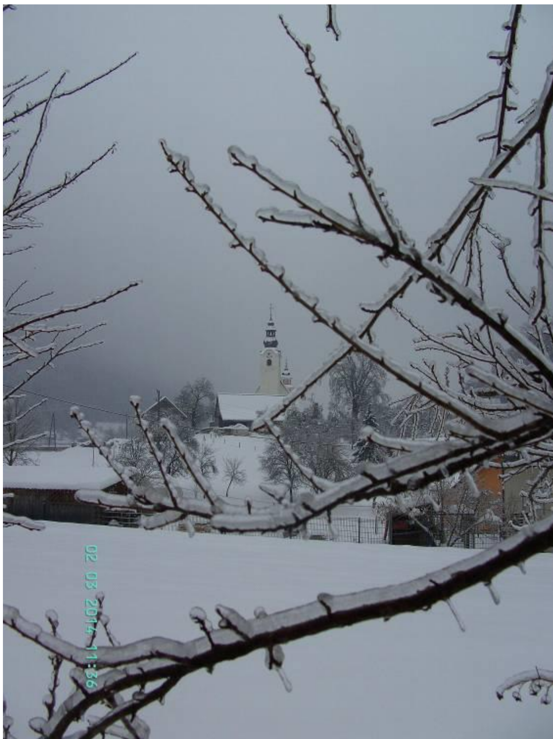
Motnik v snegu in žledu, februar 2014.