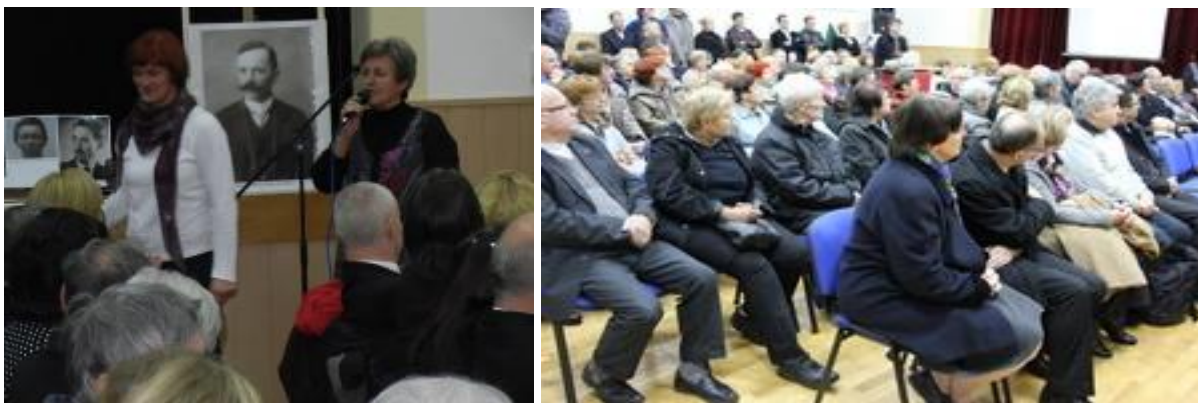
Slike s slovesnosti: kamnik.si, Vojteh Cestnik, Miha Kač, Marina Drolc.