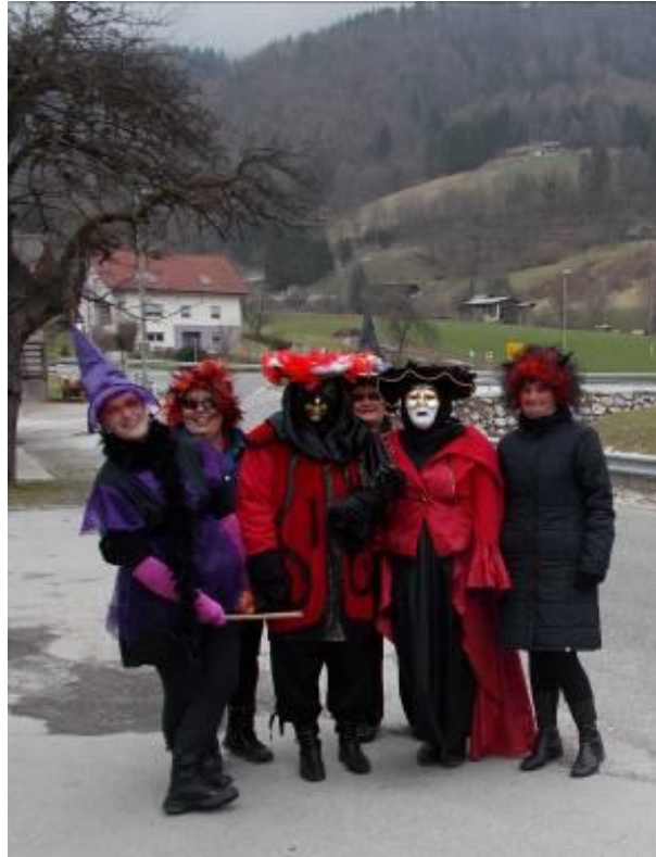
Že četrtrič se je v okviru Podeželskega društva - Utrip pod lipo domačo iz Motnika