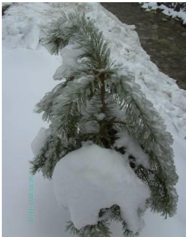
Februarski sneg in žled v Motniku, 2014, tekst in slike: Marina Drolc.