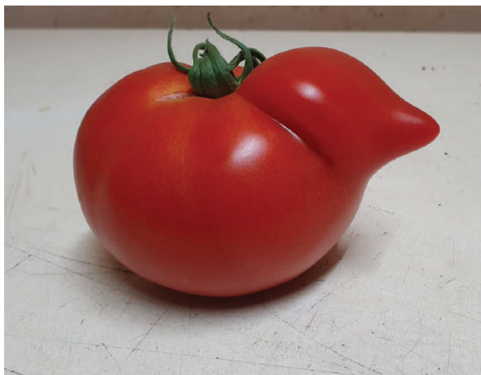
Na sliki je primer - paradižnikov pišek Matevža Hribarja.

Bodite pozorni na zanimive primerke zelenjave na vaših vrtovih, njivah, jih slikajte in pošljite v ocenjevanje Matevžu Hribarju na E-naslov: volcin@siol.net